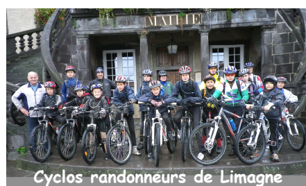
Cyclos randonneurs de Limagne